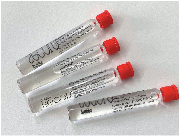
09notationGRAPPA60_1800px.jpg spirituelles kalfaterwerkzeug grappa secolo, secolo domenis® cividale del friuli | 60 % vol | 5 ml

ka(l)f'aten [ka(l)f'o:dn], Finkw. [kuf'o:dn], kalf'atern , klafaten swv., kalfatern , die Fugen zwischen den hölzernen Schiffsplanken mit Werg abdichten; 18. Jh. ( cal- , kalfatern ) und noch; aber schon 1527 kalfater Iseren , vgl. Kalfaatischen ; das Werg (oft auseinandergezupftes und zu dünneren