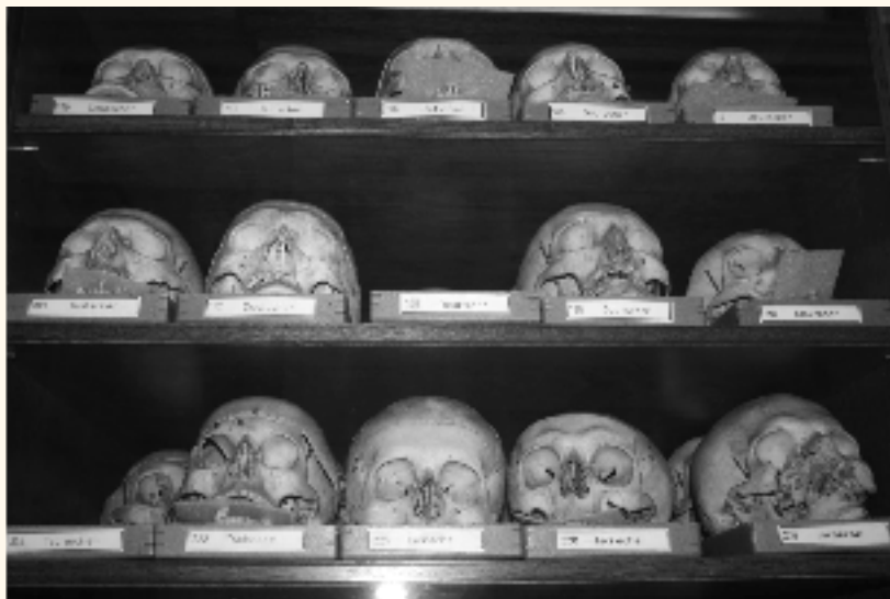
Osteologische Sammlung Naturhistorischen Museum Wien

Seit Jahrhunderten verstauben in den Regalen der Völkerkundemuseen neben rituellen Kultobjekten aber tausende Alltagsgegenstände, zudem lagern in den heiligen Hallen westlicher Zivilisation unzählige Eingeborenenskelette, angeschafft zur Erforschung rassistischer Evolutionstheorien. Geschuldet sind die unüberschaubaren Ansammlungen bleicher Gebeine den Anthropologen, Ethnologen, Archäologen, Historikern, Hinz und Kunz, die die Geschichte der Zivilisation als ein einziges, großes Spektakel der Rassen betrachteten.