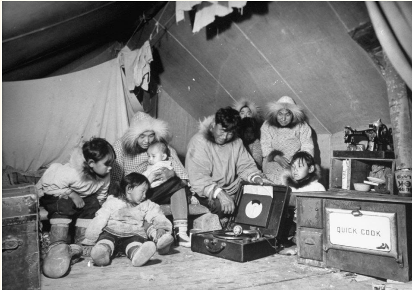
(Juli 1937, Margaret Bourke-White/The LIFE Picture Collection/Getty Images)

Seit 1900 hat sich einiges an Tantiemen für die international berühmten Eskimosongs angesammelt. Eine Gewinnausschüttung ist höchst an der Zeit. An dem Projekt beteiligt sich neben prominenten Musiklabels auch das Wiener Phonogrammarchiv: