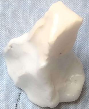
Die Gefahr an Nasen-Gallert zu werden ist im Spitzes und Hand schlingen

Etwas zwingt mich wieder und wieder die eingeströmte Luft durch den Mund zurückzuschleudern; sie keilt die Lippen voneinander und stopft den Zungenbüchel in den Rachen. Kurzer Stillstand. Tsch! Zündung. Uuu-Aaa. Explosion. Der ganze Jase Inhalt des Brust- korbs schleudert durch den Kopf und schießt aus den gespreiz- ten Nüstern als zerrissener mähiger Schleimsack und in einer Watsche kleinerer Tropfen aus dem sperr- angelweit offenen Maul. Vor meinem glitzernd starrt ein Bild im Sonnenlicht glitzert der Koko. (Ausbehn aus Yggwane Ritter Feilag 2010)